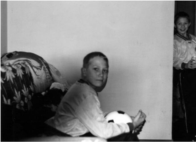
Foto jongens in WTOC-shirts