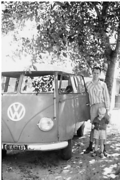
Ons eerste volkswagenbusje