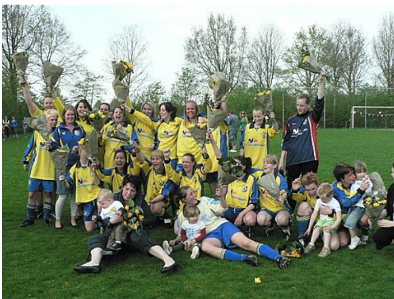
Dames 2 kampioen