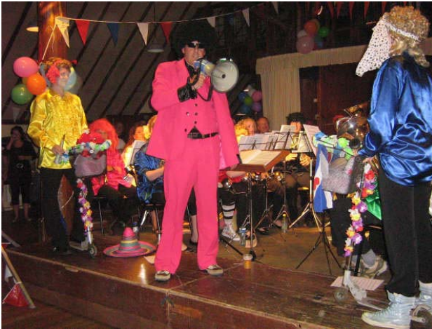
Night of Brass