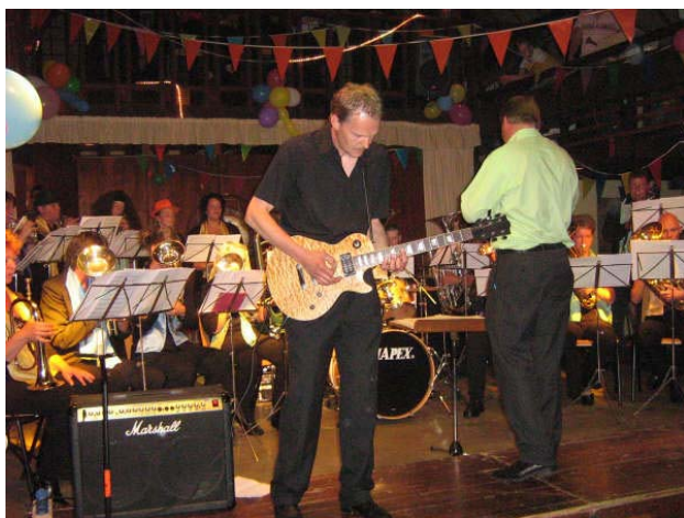
Night of Brass