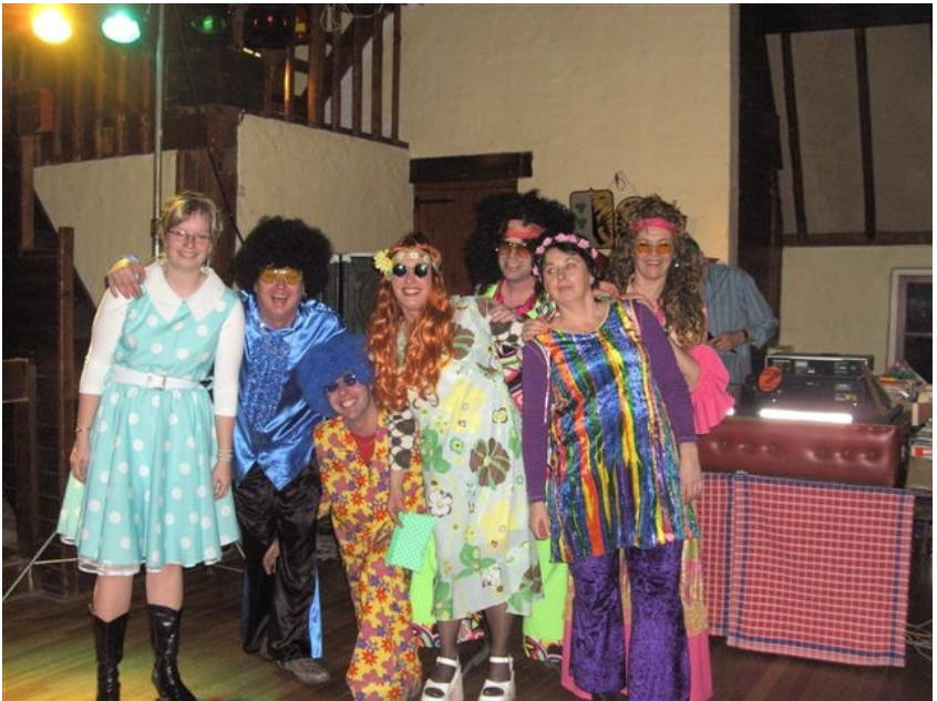
Back to the 60's and 70's party