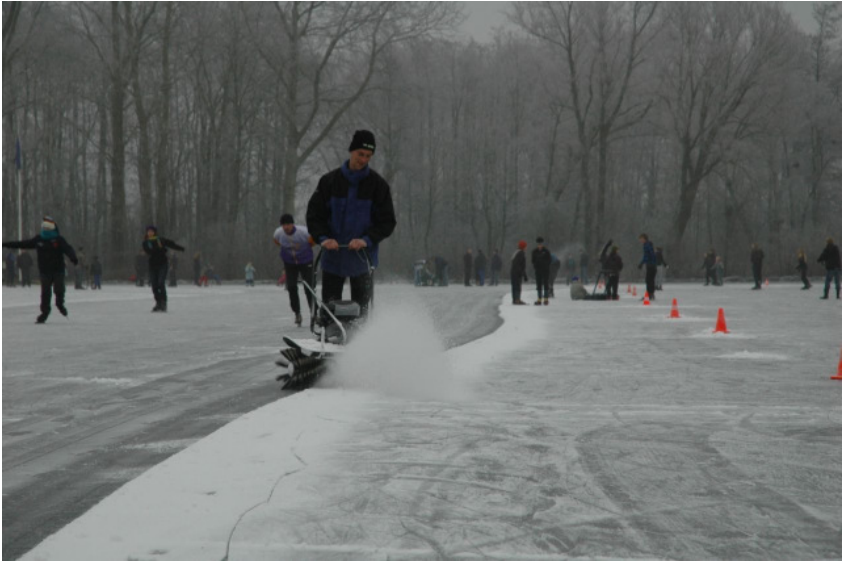
Actie op de ijsbaan